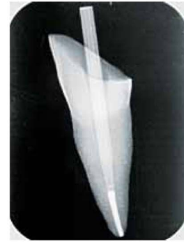
MATCHPOST Radiopacity